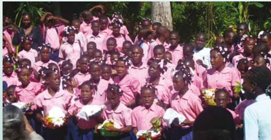
Élèves de la petite école des mornes à Roche-Pierre vous offrent leurs vœux.

Le complexe PDI compte également un important volet de développement économique. Nous devons à Mme de Verteuil la conception de divers ateliers et coopératives qui donnent un peu de travail à nos anciens élèves et aux parents : atelier de transformation alimentaire permettant à 15 groupes de femmes de travailler à la production de fruits séchés et des farines de légumes, des ateliers d'artisanat, une coopérative apicole qui donne du bon miel de campêche, sans oublier une banque de microcrédit à petit capital mais qui compte 300 membres. Nos actions ne s'arrêtent pas là, nous nous occupons aussi d'apporter une aide alimentaire à 407 vieillards et nous organisons une chorale qui a commencé à donner des résultats.»