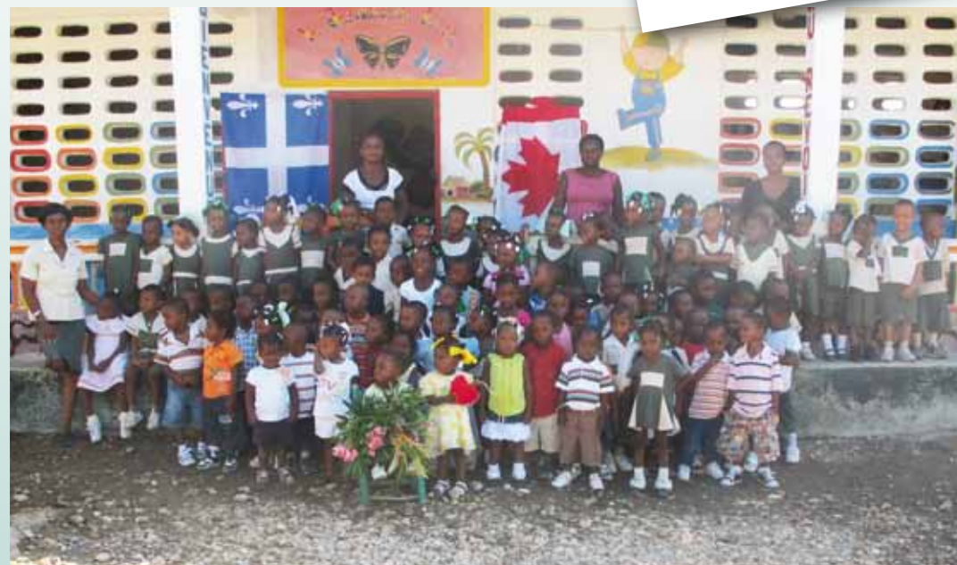
Les amis du pré-scolaire de l'école Perpétuel Secours

Notre but est de développer au maximum nos ressources qui sont surtout le potentiel des individus et il est très important de créer des activités génératrices de revenus dans un pays exposé aux catastrophes naturelles et aux crises économiques aigues. Encore merci à vous.»